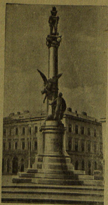
ПО ГОРОДАМ СССР Львов. Памятник Адаму Мицкевичу.